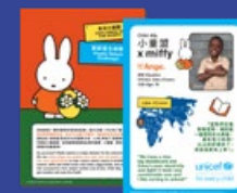
小故事 + 挑戰

為了讓本地更多家庭認識這個計劃，我們在淺水灣the pulse舉辦了UNICEF HK「小童盟 X miffy同樂日」，小朋友沿著遊戲路線前行，參與各式各樣有趣又有教育意義的活動，探索UNICEF怎樣為身處困境的兒童帶來希望和新契機。